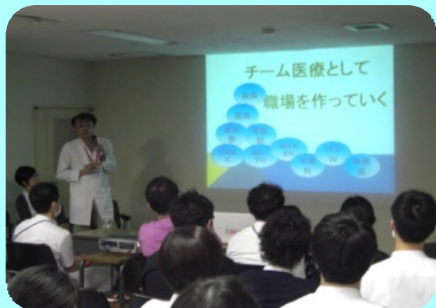
平成28年度 新入職者説明会