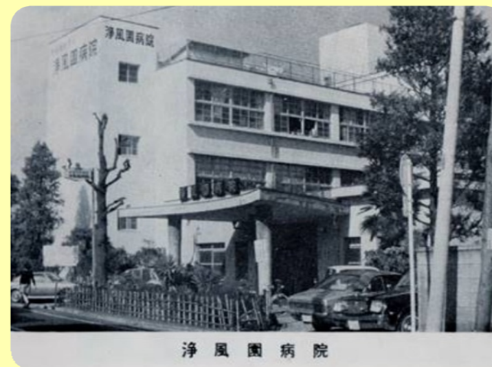
昭和25年当時の浄風園病院