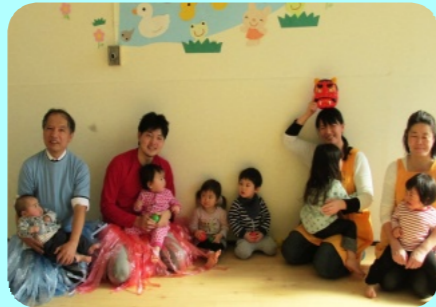
院内託児所での節分の日のイベント（赤鬼・青鬼は職員）