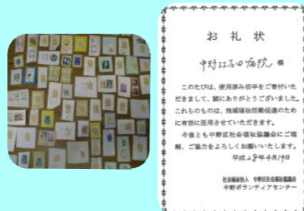
中野ボランティアセンターへ使用済み切手を寄付させていただきました