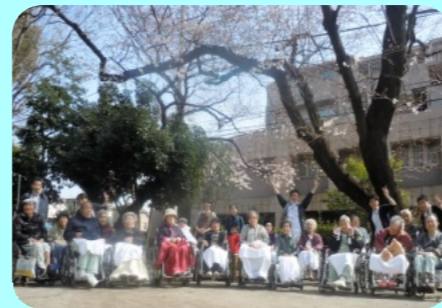
入院患者様とお花見の様子