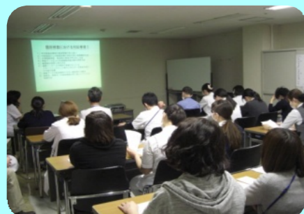
院内研修会「臨床検査における個人情報」