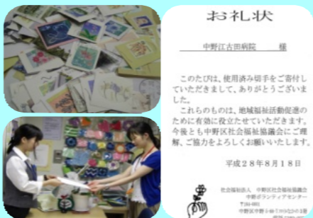
中野ボランティアセンターへ使用済み切手の寄付を継続して行っています