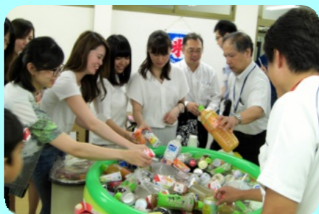
水遊び、お誕生日会の様子です