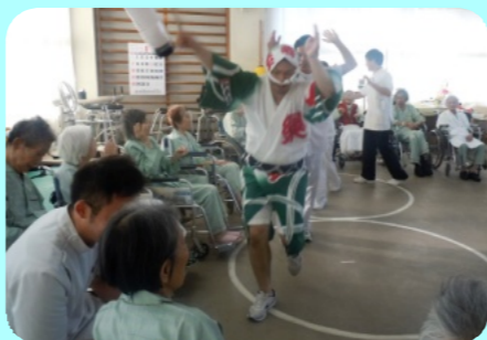
集団レクリエーション(阿波踊り)