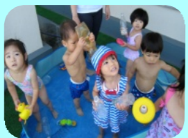
院内託児所でのイベント