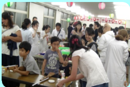
平成28年度 社会福祉法人浄風園 納涼会