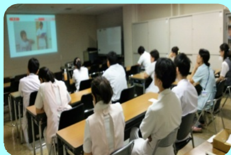
院内研修会 接遇DVD講習 「患者対応塾 基礎編・応用編」