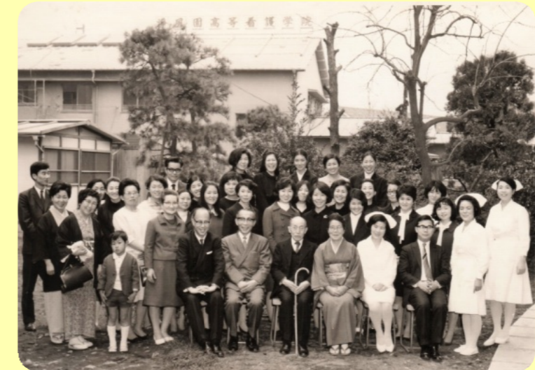
昭和45年 浄風園高等看護学院 第1回入学式の様子