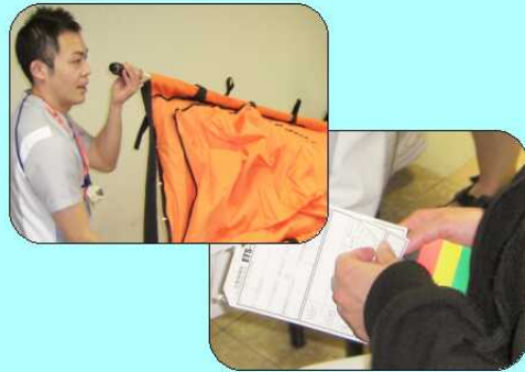
避難訓練同日にエアストレッチャー講習、トリアージ講習も実施しました。