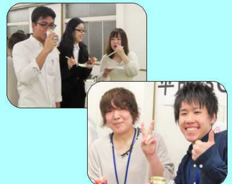
法人新入職員歓迎会のひとコマ。活気と笑いに溢れた会になりました。

新年度が始まりました。昨年、医療従事者として、そして社会人としての生活をスタートさせた職員も2年目に突入です！ 当院の未来を担う世代を代表して、5名の職員の日常を紹介します。