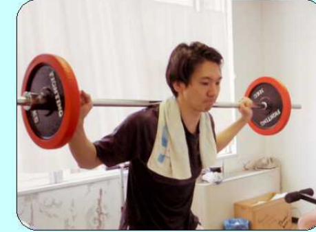
院内部活動ではフィットネス部に所属。休日にはセミナーや学会へ行くことも。