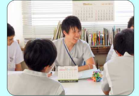
「彼に任せておけば何とかできる」と言われる存在を目指しています。