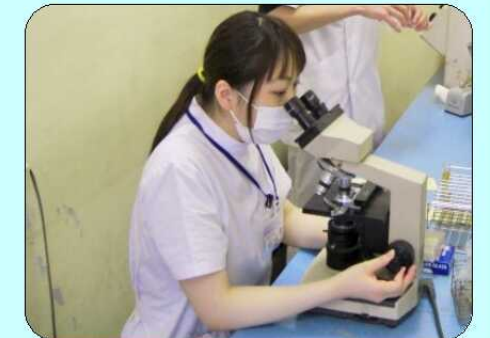
効率よく業務を進めることに気を付けています。