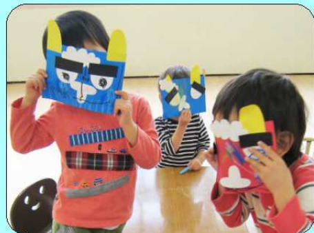
院内託児所では、季節を感じるイベントを楽しんでいます。