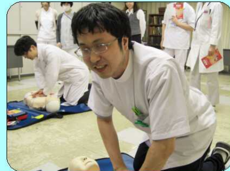
医薬品・医療機器安全管理委員会がAED講習会を開催しました。