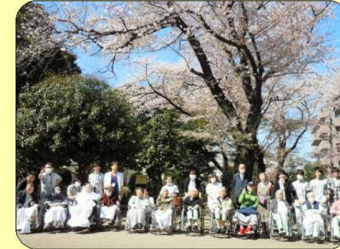
看護部、リハビリテーション科による春恒例のお花見にて撮影