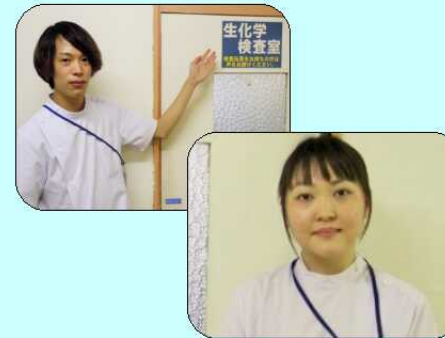
臨床検査科：臨床検査技師

新年度が始まりました。昨年、医療従事者として、そして社会人としての生活をスタートさせた職員も2年目に突入です！ 当院の未来を担う世代を代表して、5名の職員の日常を紹介します。