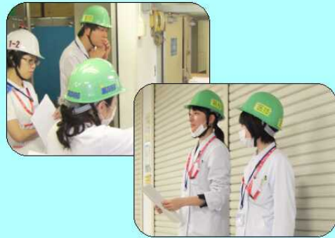
避難訓練を実施。災害発生時の役割を確認しました。