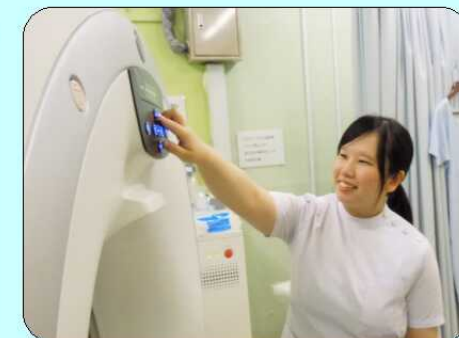
仕事に気をつけていることは、とにかく挨拶です。