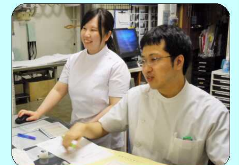
先輩との連携もばっちりです。