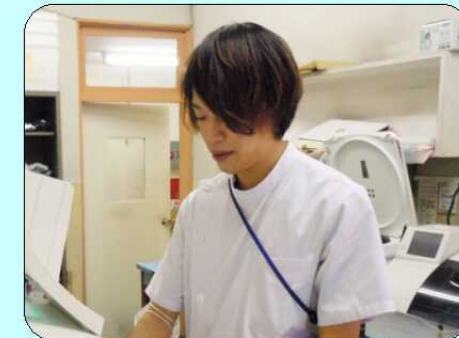
エコーを覚えるなどして、業務の幅を広げることが今後の抱負です。