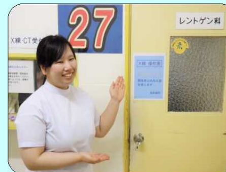
放射線科：診療放射線技師