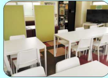
(左) テーブルと椅子を刷新。多目的に利用できるよう配置。 (右) ソファスペースを新設。職員が談笑する姿も増えました。

今後は患者様やご家族を始めとする面会の方にも開放できるように準備を進めています。