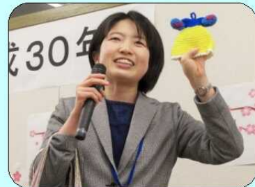
(左) 新入職員歓迎会にて各部お披露目。手芸部は作品を紹介。 (右) ビューティー・フィットネス部のエアロビ体験会。