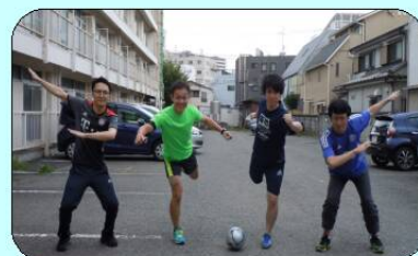
仕事終わりにいざ、出発！！