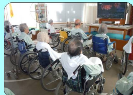
集団レクリエーション② 長岡花火鑑賞会