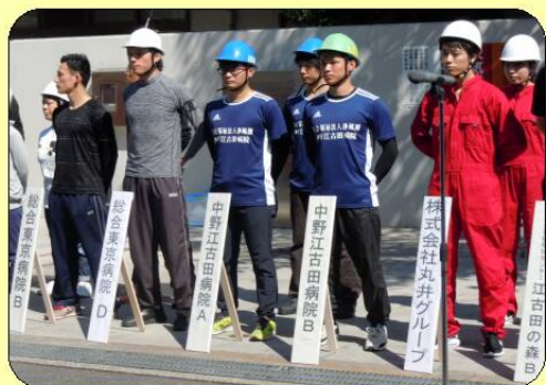
野方消防署主催 自衛消防訓練審査会 2号消火栓の部 2連覇達成しました!!