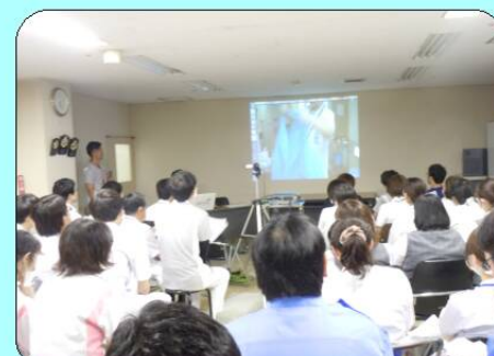
感染対策委員会主催 標準予防策勉強会