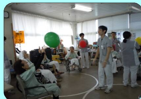
集団レクリエーション① 風船バレー