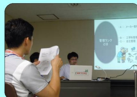
医療安全管理委員会主催 医療機器勉強会