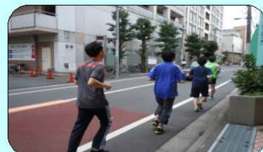
近くの公園までランニング♪