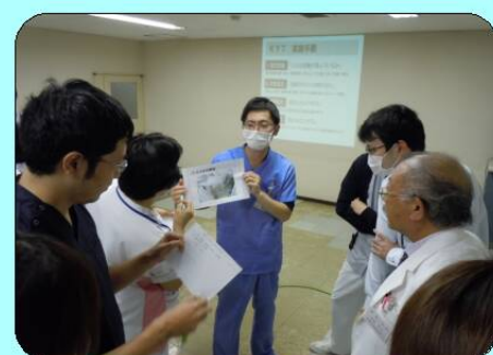
医療安全管理委員会主催 危険予知トレーニング