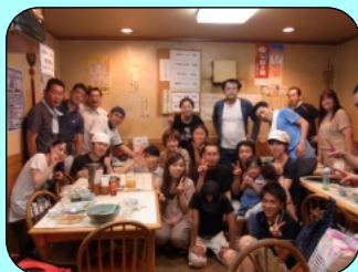
野球部試合後 2年間無勝 夏の納涼会