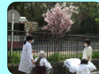
入院患者さん花見 近隣公園に主治医も同行