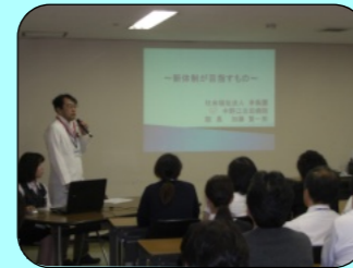
新病院長施政方針発表